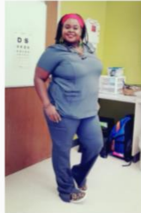
Purity Ngunyi Secondary Nurse